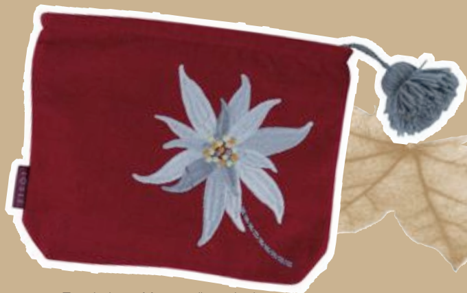
Täschchen „Montana“ von Iosis aus bestickter Wolle, 39 €