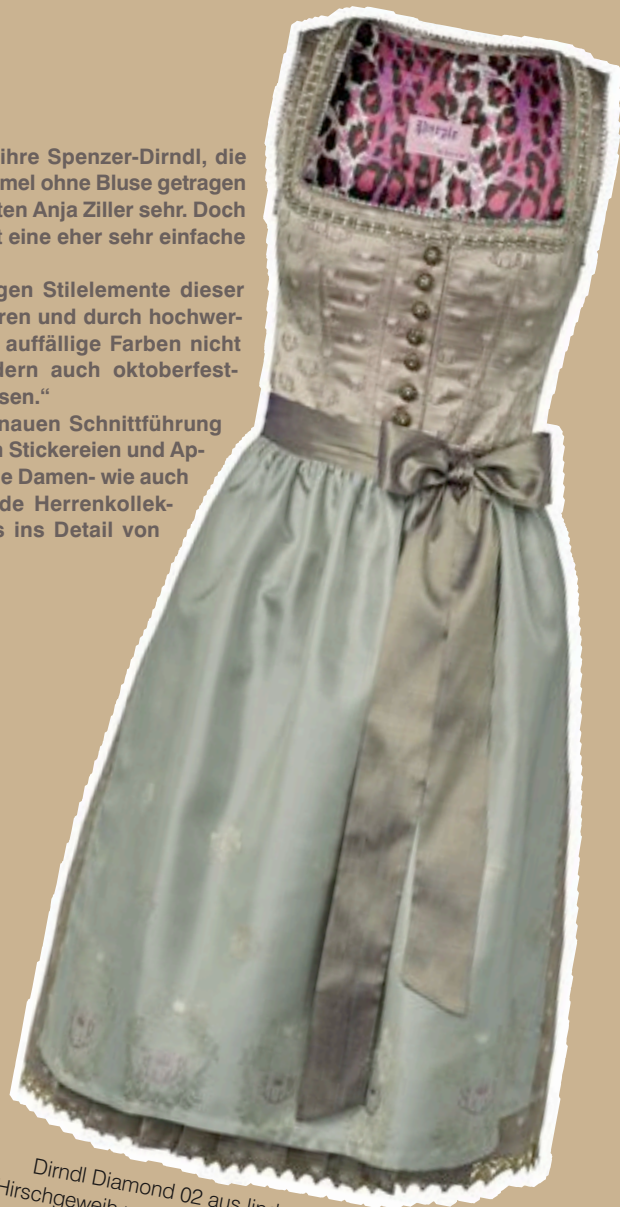
Dirndl Diamond 02 aus lindgrünem Seidenstoff mit Hirschgeweih und Krönchen-Motiv, verziert mit Swarovski-Steinen und edler goldener Perlenbordüre, 1.098 €

Wegen der maßgenauen Schnittführung und der liebevollen Stickereien und Applikationen wird die Damen- wie auch die dazu passende Herrenkollektion liebevoll bis ins Detail von Hand gefertigt.