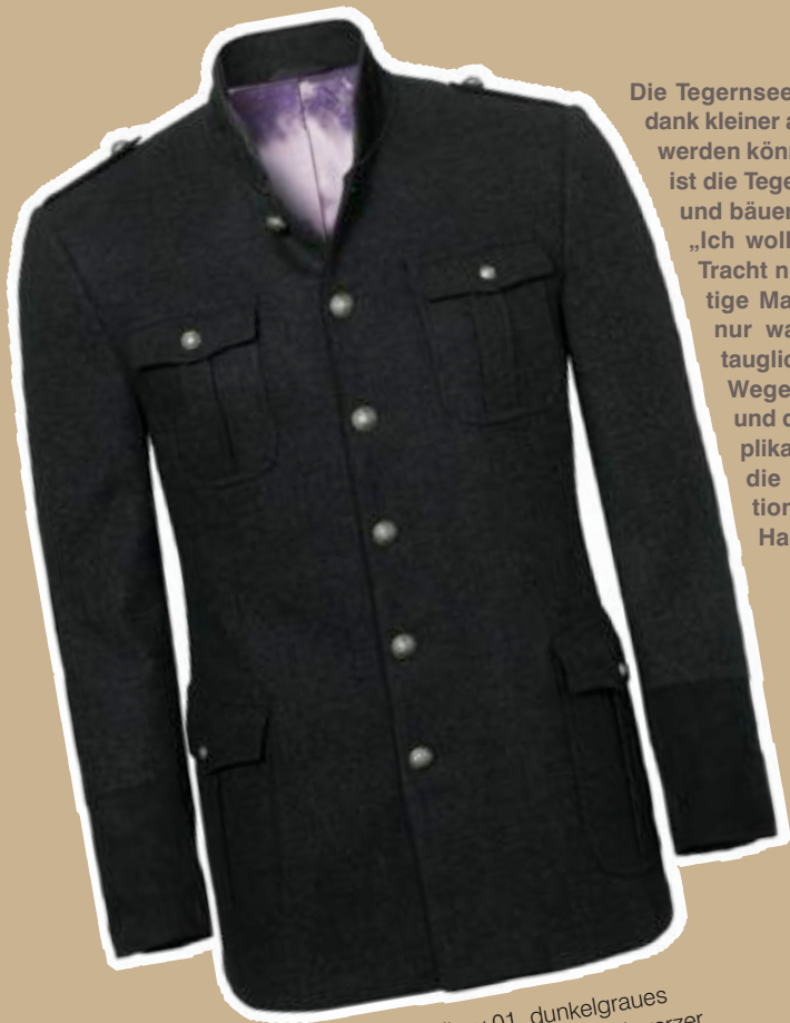
Herrenjanker Hellboy 01, dunkelgraues Fischgrätmuster in Lambswool mit schwarzer Baumwollkordel-Paspel, abgesetzt mit Velours-Leder, € 998 €

Die Tegernseer Tracht und ihre Spenzer-Dirndl, die dank kleiner angenähter Ärmel ohne Bluse getragen werden können, faszinierten Anja Ziller sehr. Doch ist die Tegernseer Tracht eine eher sehr einfache und bäuerliche.