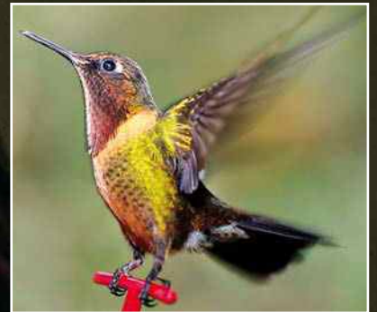
Kolibri in seiner Originalgröße 3-4 cm.

Sie sind Ultra-Federgewichte, wiegen nicht mehr als 20 Gramm (wie ein Standardbrief) und sind die leichtesten und farbenprächtigsten Vögel dieser Welt. Ihre Gefieder glänzen und schimmern wie geschliffene Brillanten. Die im Spanischen »Picaflor« (Blütenpicker) genannten Winzlinge gibt es nur zwischen Alaska und Feuerland, dort jedoch in mehr als 330 Arten und in über 100 Gattungen. Im Flug schnellen ihre Zungen bis zu 200 p/min. tief in die Blüten, um an den süßen Nektar zu gelangen. Ihre Flügel bewegen sich im 180-Grad-Winkel und erlauben so das »Stehenbleiben« vor einer Blüte. Sie können sogar rückwärts fliegen! Die Schlagfrequenz ihrer Flügel beträgt bis zu 80 Schlägen pro Sekunde. Der Energieaufwand kostet Kraft und so gibt es in den Anden eine Art, die wegen der großen Höhe und Kälte in eine regelrechte Starre verfällt, um wertvolle Energie zu sparen. www.faszination-regenwald.de