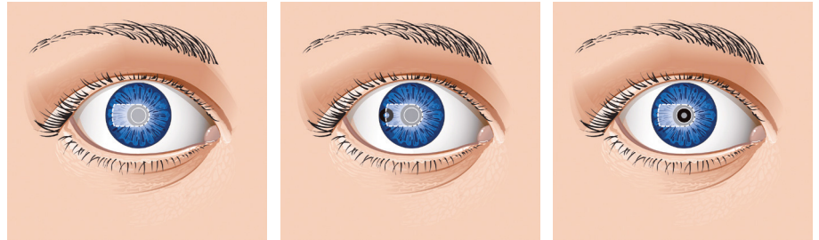
Illustration: Pocket-Implantation

Bei diesem hauchdünnen Hornhautimplantat handelt es sich um einen Ring mit nur 3,8 mm Durchmesser und einer zentralen Öffnung von 1,6 mm, der mit Hilfe des Femtosekunden-Lasers in die Hornhaut des nicht-dominanten Auges implantiert wird. Dazu wird zunächst ein sehr kleines Hornhaut-Deckelchen ( Pocket )