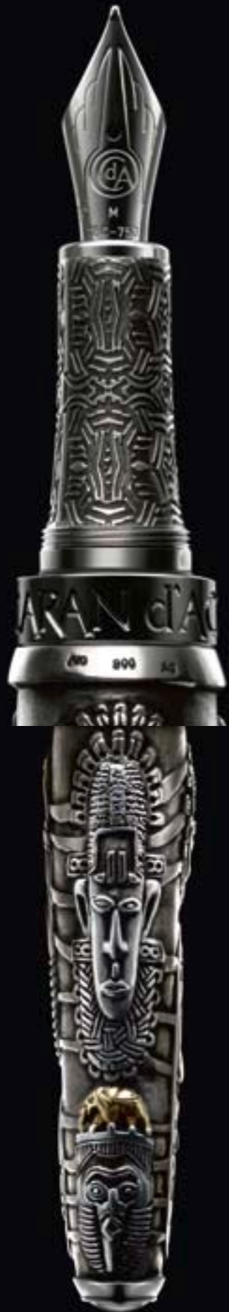
carandache Tribal African Masks

Juwelier zum Sande GmbH Ecke Wasserburger Landstr. 224 / Usambarastraße 12 81827 München Tel. 089 / 4303131 www.zum-sande.de info@zum-sande.de