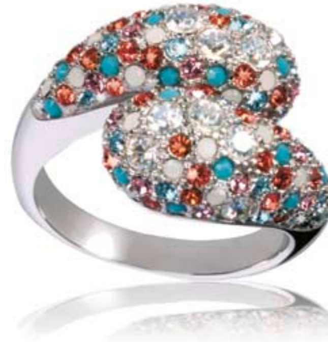
Glamour World GR33-24 www.timemode.com